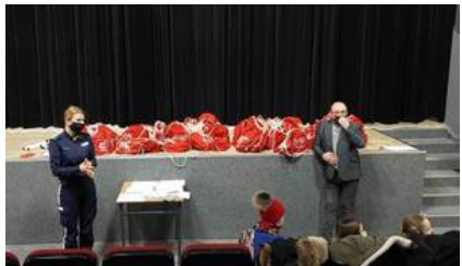
Spotkanie z wolontariuszami WOŚP